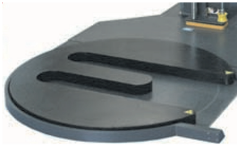
Entrada carga lateral