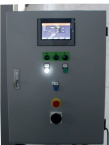
Panel de mando

Con pantalla táctil para configuración de programas