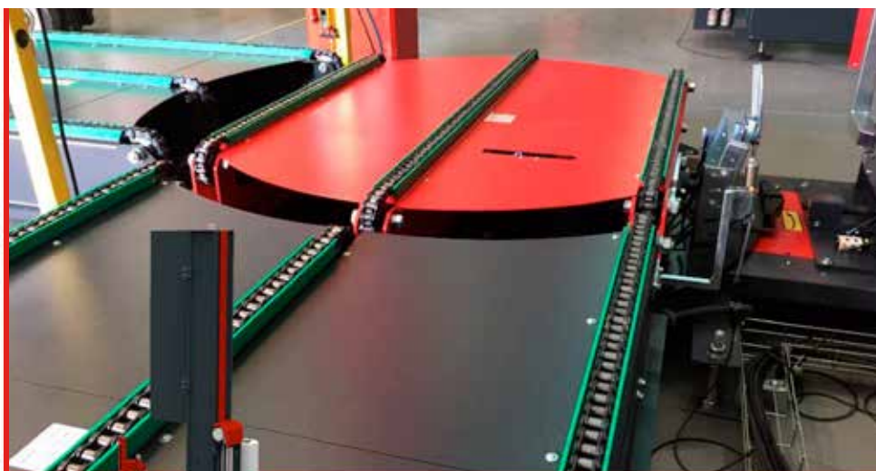
iTRM500 con transportador de 3 cadenas