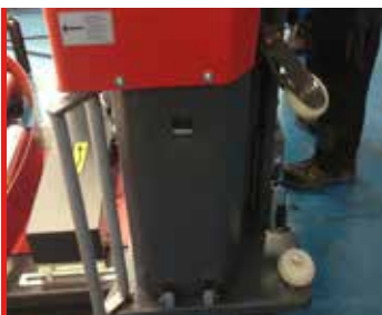
Prestirotor motorizado 300%