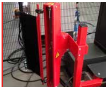
Brazo corte de film