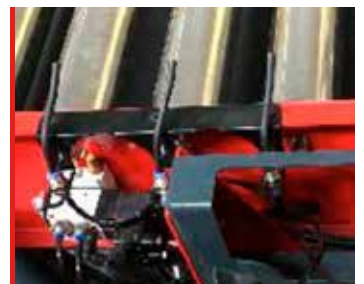
Sopladores de cola inicial