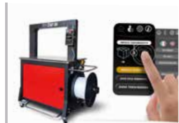
Panel de Control Táctil