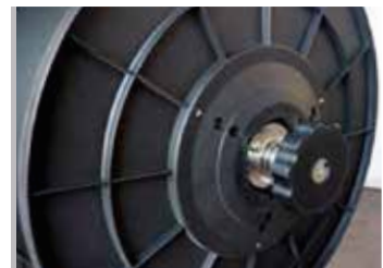
Cambio de bobina de fleje