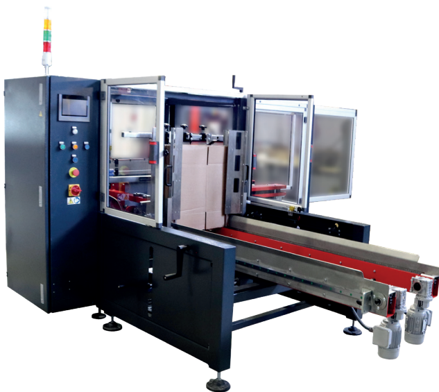
Versión con almacén de cajas motorizado

La calidad y formato de las cajas será verificado y aprobado por la oficina técnica de Be Global Supplies