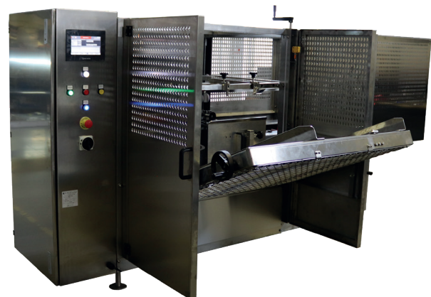
Versión acero inoxidable