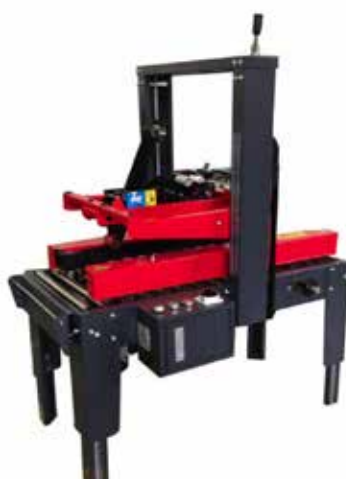
iP15S configuración estándar