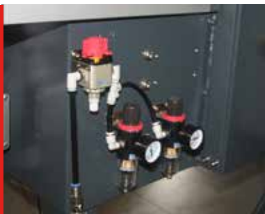
Medidores presión aire

Otros colores bajo petición (puede suponer un extracoste)