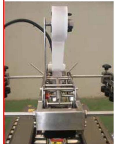
Cabezal de precintado

La calidad y formato de las cajas deberá ser verificado y aprobado por la oficina técnica de iHRESS