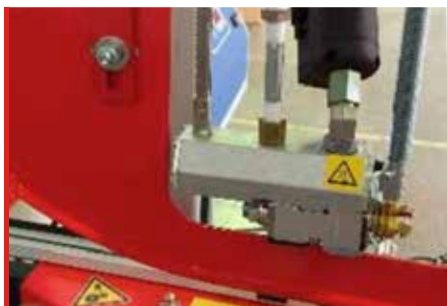
Cierre con Hot Melt (OPCIÓN)